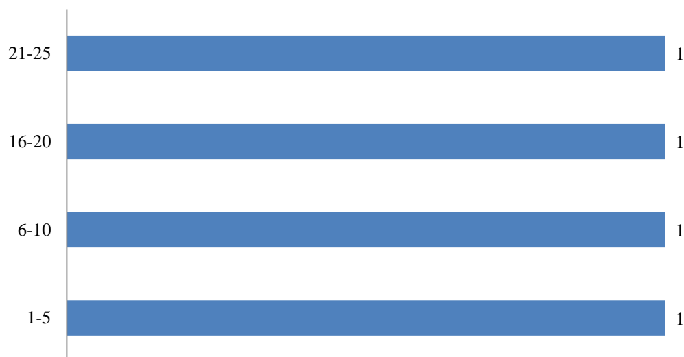
Gráfico 3: Tempo de resposta (em dias)

O tempo médio de resposta no mês de fevereiro de 2017 é de 13,75 dias. Não houve pedido de prorrogação de prazo no período.