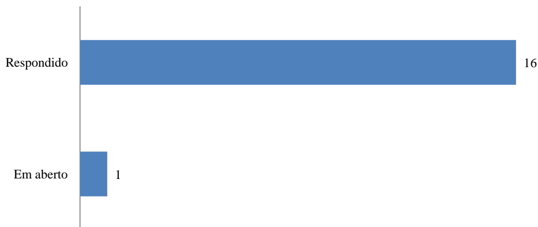
Gráfico 1: Situação dos pedidos de acesso à informação

No mês de dezembro de 2016 foram registrados 17 (dezessete) novos pedidos de acesso à informação, sendo 16 (94,12%) respondidos e 1(5,88%) em aberto.