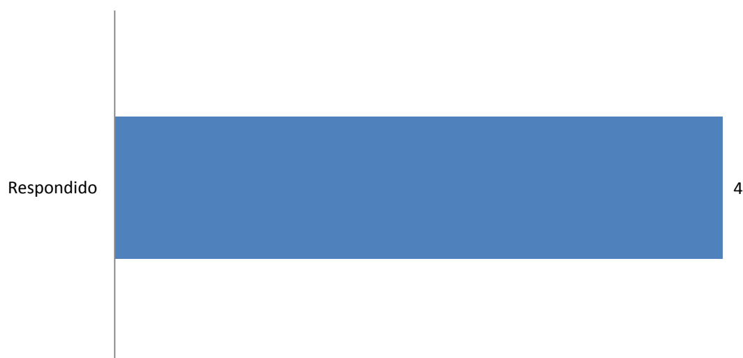
Gráfico 1: Situação dos pedidos de acesso à informação

No mês de janeiro de 2016 foram registrados 4 (quatro) pedidos de acesso à informação, sendo 100% respondidos.