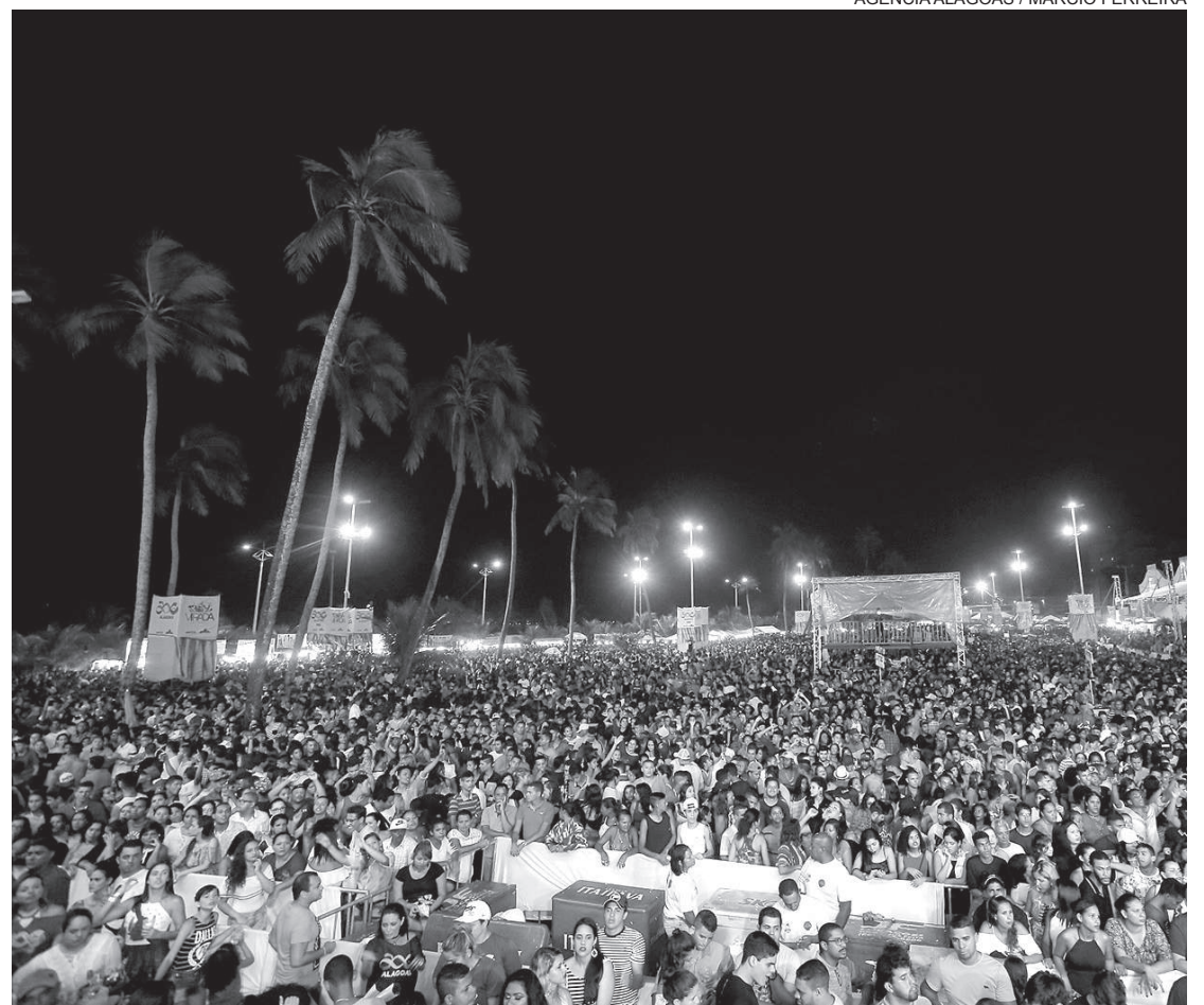
Para celebrar 200 anos de Alagoas, Virada Cultural reuniu cerca de 50 mil pessoas por noite no fim de semana em Jaraguá