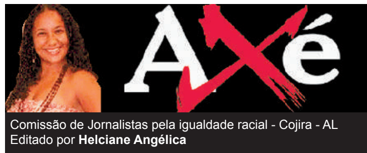
Comissão de Jornalistas pela igualdade racial - Cojira - AL Editado por Helciane Angélica

“Vamos manter a Virada Cultural. Não tem como acabar com um evento como esse. Esse ano, o Governo do Estado fez o Carnaval com o desfile do Pinto da Madrugada, fez o São João e agora está fazendo a Virada Cultural, ou seja, ficaram a cargo do Governo as grandes atrações culturais do ano”, finalizou Renan Filho.